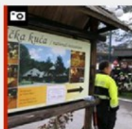
SJEČATE SE LIČKE KUĆE?