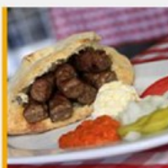
ĆEVAPI SU IN

Telegraph: Balkanska hrana je novi svjetski hit