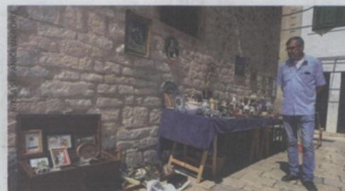
Srećko Vukšić prodaje antikvitete na štand