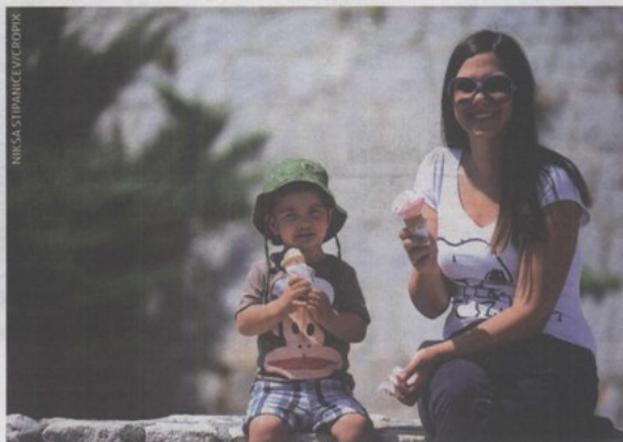
Prvog dana lipnja dječak s mamom odlučio je uživati u sladoledu

Kraj svibnja i početka lipnja donio je velike promjene u samom Šibeniku - grad je naprosto živnuo! Uz cjelodnevni šušur po šibenskim ulicama, održane su i brojne manifestacije kojima je tek najavljeno još zanimljivije i bogatije ljeto. Uostalom, uvjerite se, sve su zabilježili naši fotoreporteri