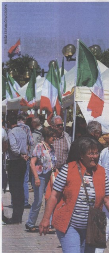
Brojni Šibenčani i njihovi gosti posjetili su mediteransku tržnicu s talijanskim specijalitetima