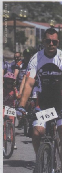
Na bicikljadi Radio Šibenika, čiji je

Kraj svibnja i početka lipnja donio je velike promjene u samom Šibeniku - grad je naprosto živnuo! Uz cjelodnevni šušur po šibenskim ulicama, održane su i brojne manifestacije kojima je tek najavljeno još zanimljivije i bogatije ljeto. Uostalom, uvjerite se, sve su zabilježili naši fotoreporteri