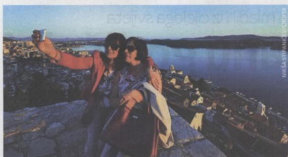
Sve je više onih koji se žele ovjekovječiti fotografijom s tvrđave svetog Mihovila s pogledom na Katedralu svetog Jakova i Kanal svetog Ante

4 Aktualno Šibenski list ČETVRTAK, 4.6.2015.