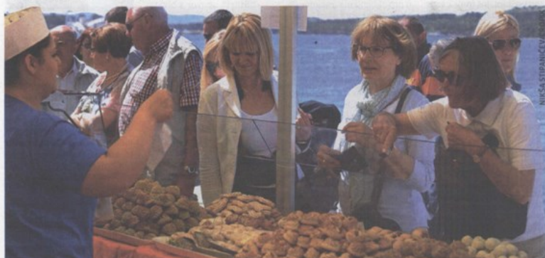
U sklopu festivala Okusi Mediterana na šibenskoj rivi održana je mediteranska tržnica s Italia Fest, festivalom talijanskih gastronomskih specijaliteta